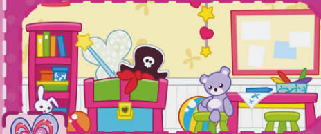
Habitación de juegos