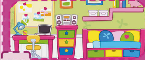
Habitación de estudio